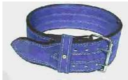
Разрешенные модели поясов

г. Пояс: участник может надеть поверх костюма пояс (ремень), с шириной не более 10,16 см и толщиной 1,27 см. Пояс не должен иметь дополнительных мягких прокладок, креплений или подпорок из любого иного материала снаружи или внутри пояса. Пояс изготавливается из кожи или винила, из одного или нескольких слоев, склеенных и/или прошитых между собой.