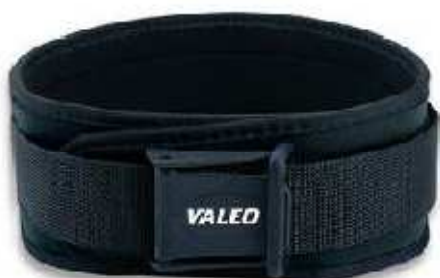
Заборонені моделі пасків

ж)Взуття: під час виконання вправ спортсмен повинен бути взутим у спортивне взуття. Металеві зажими або шиповки заборонені. Дозволяється використовувати захисне екіпірування для гомілки під час виконання станової тяги, але вона повинна бути прикрита шкарпетками. Не допускається нанесення на взуття будь-яких змащувальних матеріалів або сторонніх речовин.