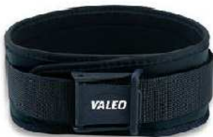
Заборонені моделі пасків

ж) взуття: під час виконання вправ спортсмен повинен бути взутим у спортивне взуття. Металеві зажими або шиповки заборонені. Дозволяється використовувати захисне екіпірування для гомілки під час виконання станової тяги, але вона повинна бути прикрита шкарпетками. Не допускається нанесення на взуття будь-яких змащувальних матеріалів або сторонніх речовин.